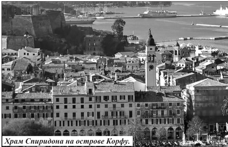
Храм Спиридона на острове Корфу.

В 325 году в византийском городе Никее состоялся первый Вселенский собор, на котором был утвержден Символ веры. На этом соборе выступал и епископ города Тримифунта. Он горячо защищал христианскую веру, обличал ереси. Благодаря помощи Всевышнего смог убедить в своей правоте красноречивых ораторов и лучших философов и преподнести собравшимся неоспоримое доказательство единства Святой Троицы. Для этого старец сжал в руке кирпич. В небо взметнулось пламя, на землю истекла вода. Разжав ладонь, праведник продемонстрировал всем оставшуюся глину и произнес: «Се три стихии, а плинфа (кирпич) одна. Так в Пресвятой Троице три лица, а Божество едино».